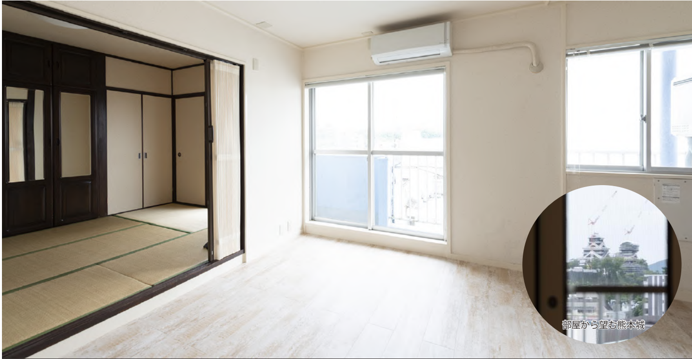
部屋から望む熊本城

また、近年頻発する大規模災害による停電への備えとして、500Whのポータブルバッテリーと100Wのソーラーパネルも設置しているため、ソーラーパネルで発電、充電することが可能です。コンセントからも充電できるので、梅雨時期など日照時間の短い時期でも問題なく使用できます。いざというときに正しく使えるように、日頃から使ってもらうことをお願いしています。